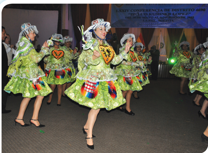
Grupo de damas rotarias de los clubes de La Paz, disfrazadas con el traje de la danza de la "Cullaguada", deleitando a los asistentes con ritmo y colorido.