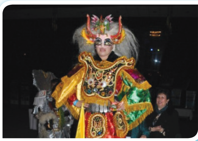
Una Dama disfrazada de "Diablesa" representando al Rotary Club de Oruro.