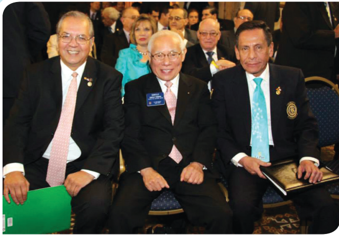
El Pdte.de R.I. Sakuji Tanaka y EGD .....