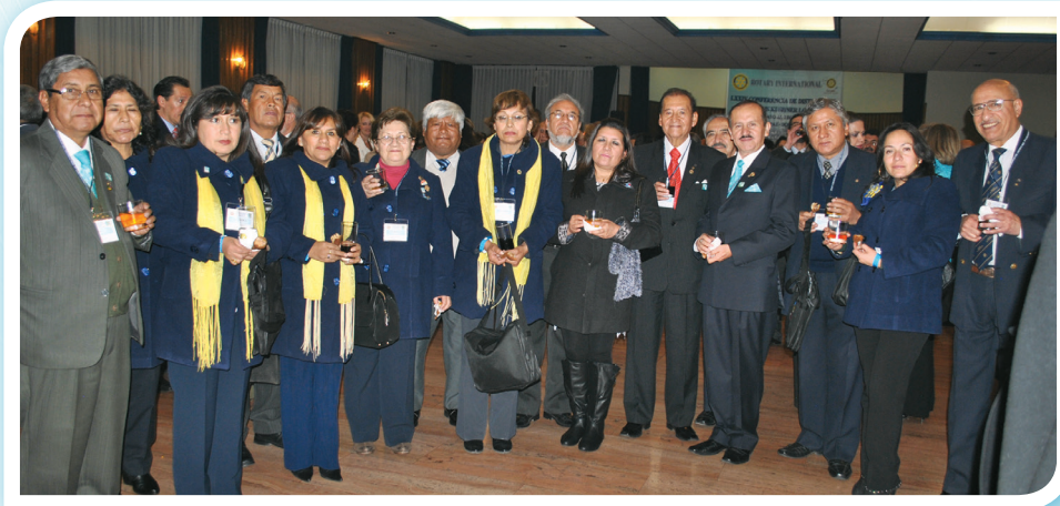
Grupo de rotarios del país en el Coctel de Mutuo conocimiento.