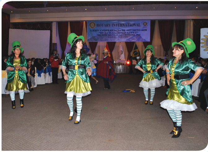
damas rotarias del Rotary Club Tupiza ejecutando su danza típica del lugar.