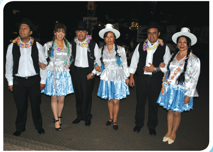
Damas y caballeros rotarios del Club de Cochabamba, con sus disfraces típicos