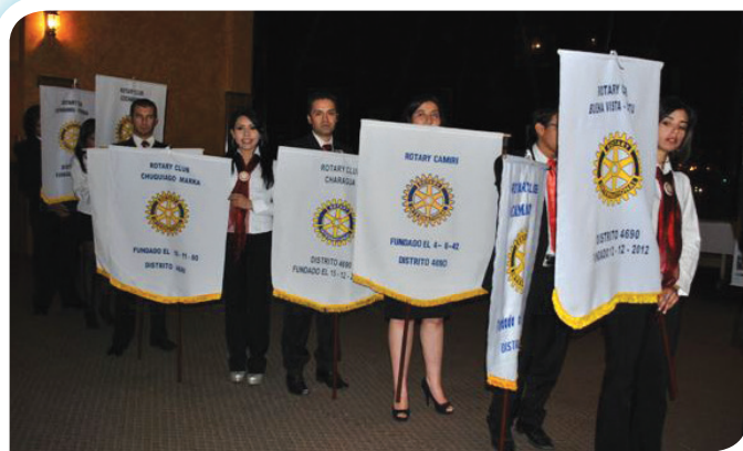
Desfile de banderas de los clubes del Distrito que portan los jóvenes rotaractianos.