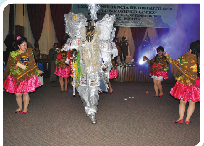
Damas y caballeros rotarios del Rotary Club San Miguel de Oruro, con la danza de la Morenada.