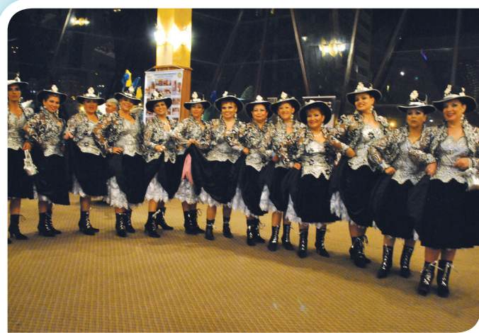
Damas Rotarias de los clubes de la Paz Zona I en la Peña de Talentos, que deleitaron con la danza de la Morena.