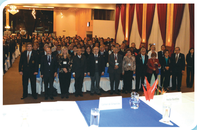
Asistentes a la Inauguración de la Conferencia lado izquierdo del Salón de Oro del COE