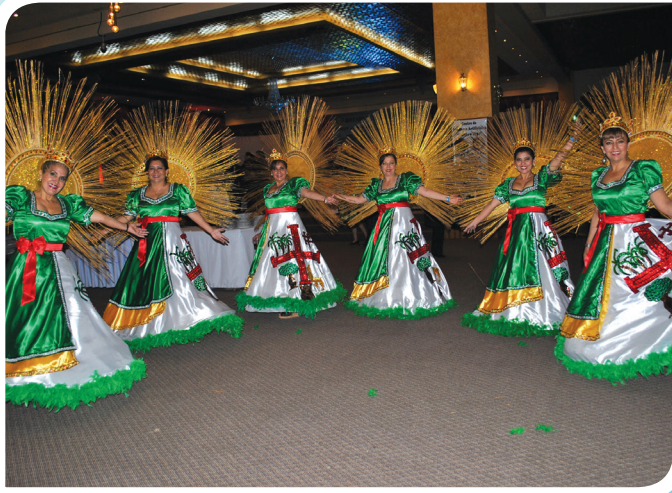
Damas rotarias de Santa Cruz con la danza típica Oriental.