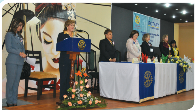
Solemne Inauguración del Panel de Damas en el salón del Jardín Japonés.